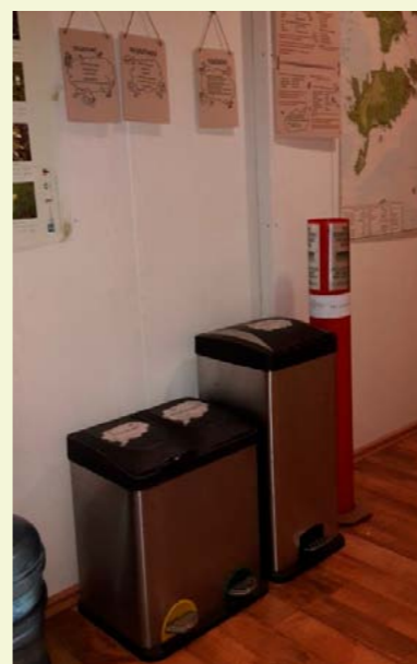
Autor: Tallinna Keskkonnaamet Jäätmete liigiti kogumine Tallinna Keskkonnaametis

Viimastel aastatel on nii EMAS-i kui ka Rohelise Kontori süsteemi rakendamine hoogustunud just Eesti avaliku sektori organisatsioonides. Kuna avalikul sektori eesmärk on tagada jätkusuutlik ja rahulolu pakkuv elukeskkond, siis sobib keskkonnajuhtimine ja -korraldus hästi riikliku poliitika elluviimise ehk avaliku haldusega tegelevate riigi- ja omavalituste juhtimisse. Kogemused näitavad, et keskkonnajuhtimissüsteemi rakendamine avaliku sektori organisatsioonides aitab kaasata erinevaid sihtrühmi ja tutvustada olulisi keskkonnateemasid ning lisaks suurendada avaliku sektori toimimise tõhusust.