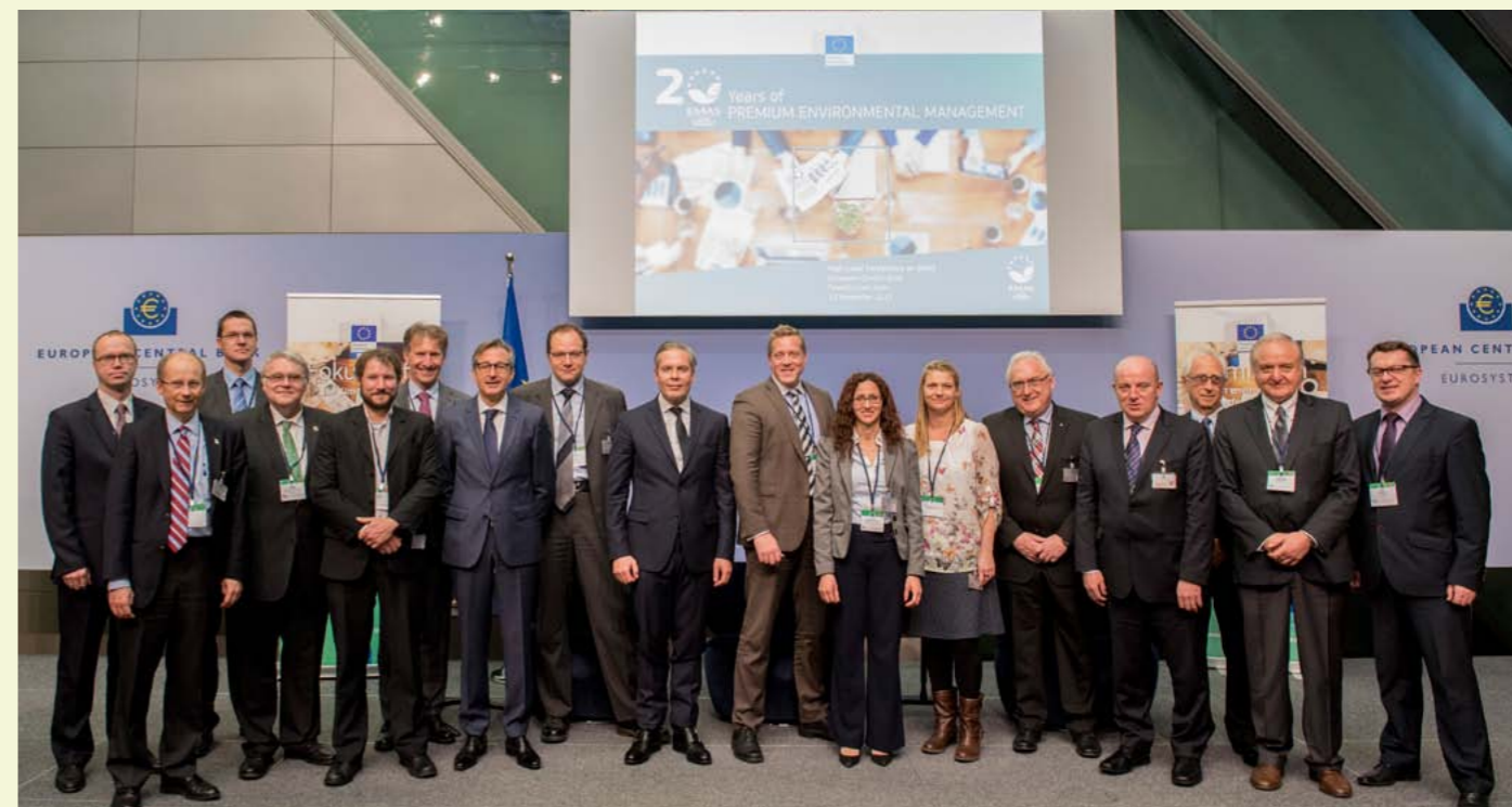
Kõik EMAS tunnustuse saanud ettevõtted ja organisatsioonid. Autor: Euroopa Komisjon