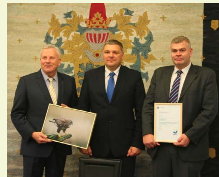
Keskkonnaminister Marko Pomerants andis Tallinna Keskkonnaametile üle EMAS sertifikaadi.